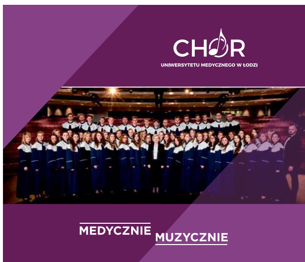
Okładka płyty Medycznie-Muzycznie