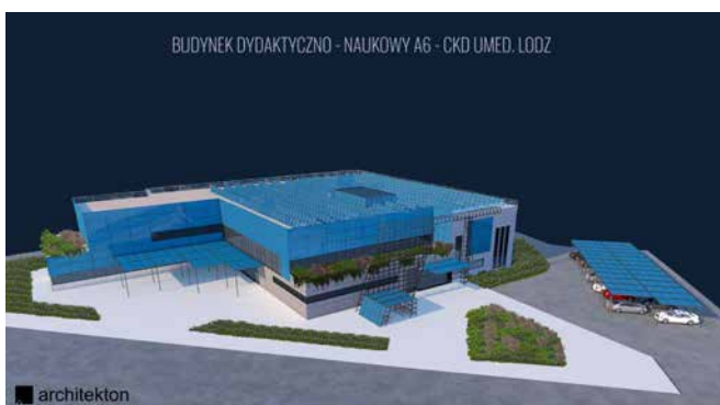
Projekt – PASYWNEGO BUDYNKU LABORATORYJNO-NAUKOWO-DYDAKTYCZNEGO – MOLEcoLAB