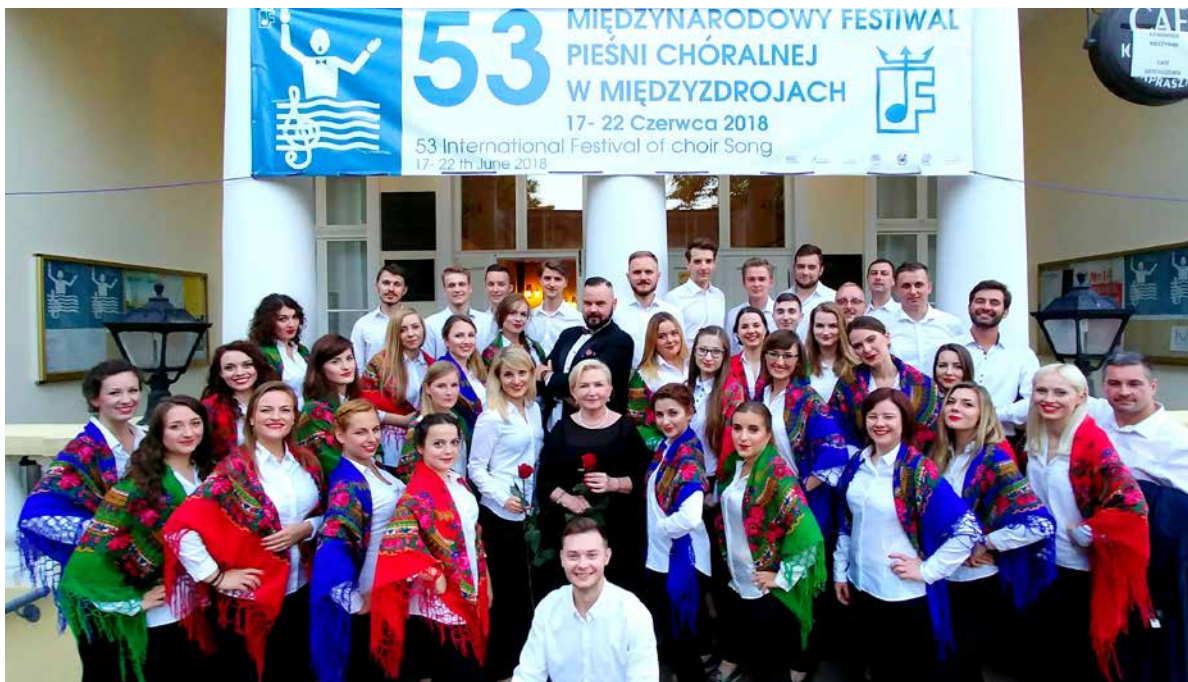
Chór Uniwersytetu Medycznego w Łodzi w strojach ludowych po występie konkursowym podczas 53. Międzynarodowego Festiwalu Pieśni Chóralnej w Międzyzdrojach

Zanim jednak staniemy do najtrudniejszego konkursu w naszej karierze, czeka nas niesamowita podróż artystyczna do Nowego Jorku. To pierwsza tak daleka wyprawa naszego Chóru, jednak nie byłaby ona możliwa bez wsparcia władz uczelni, za które pragniemy podziękować z całego serca. Jesteśmy dumni, że nasz śpiew po raz pierwszy zabrzmiał na innym kontynencie. Zagramy koncerty m.in. w siedzibie ONZ, Konsulacie Generalnym RP, Centrum Polsko-Słowiańskim, polskich klubach seniora, jednak głównym celem naszej podróży jest udział w 81. Paradzie Pułaskiego oraz koncert w Katedrze św. Patryka. To wielkie święto Polonii amerykańskiej, dlatego niezmiernie cieszymy się, że będziemy częścią tego wyjątkowego wydarzenia.