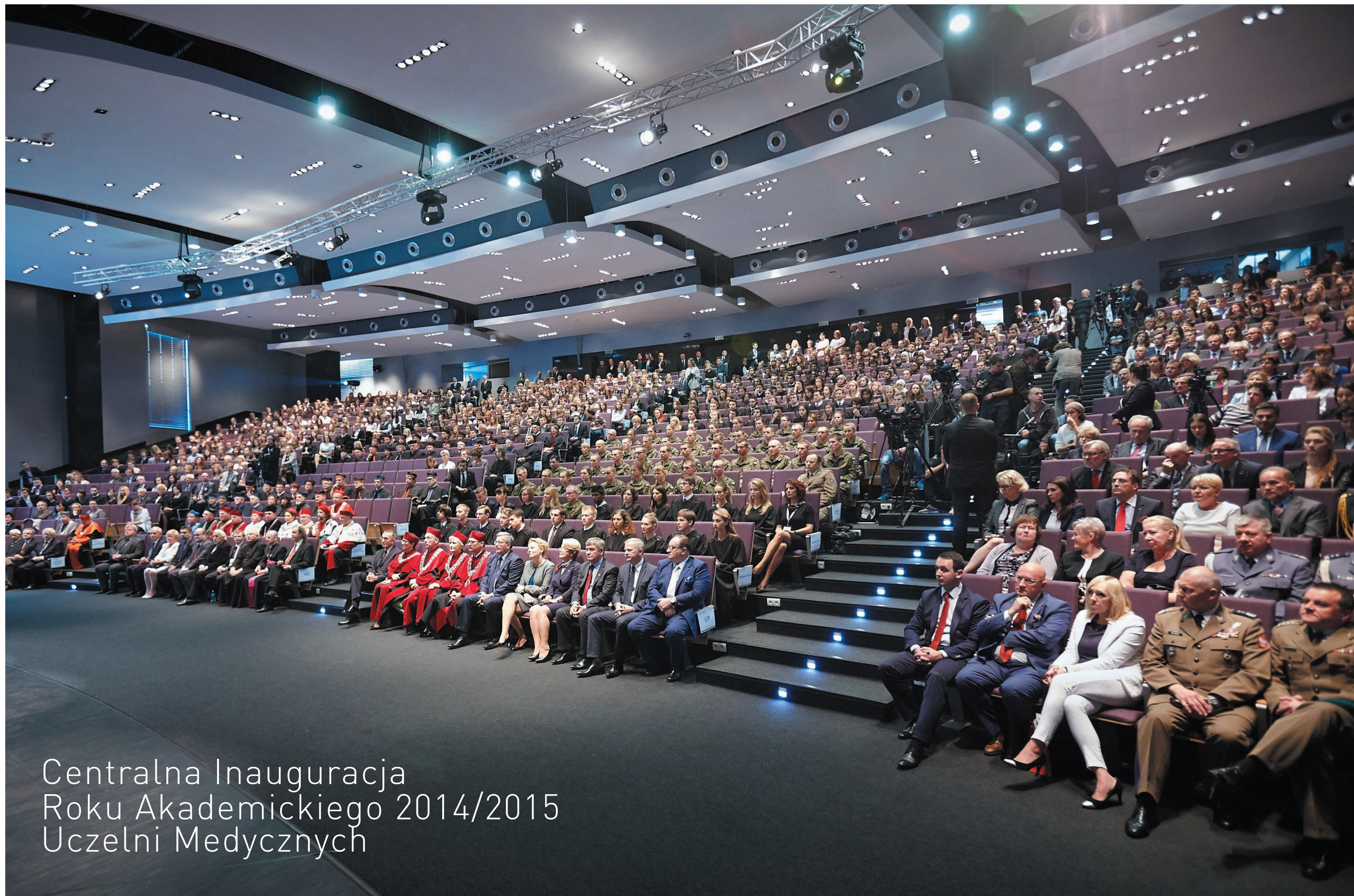
Centralna Inauguracja Roku Akademickiego 2014/2015 Uczelni Medycznych